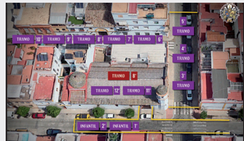
Distribución de los tramos del Señor y del 8º tramo de Virgen en las calles aledañas al templo y en el interior del mismo.

— Si tenemos que abandonar la estación de penitencia, debemos comunicárselo al celador de tramo, que está siempre para ayudarte.