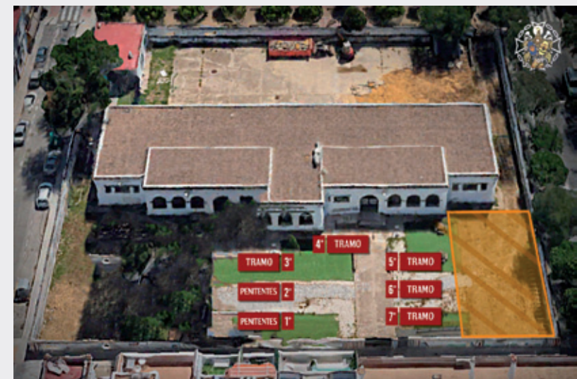
Distribución de los tramos de la Virgen (1º al 7º) en el Espacio Ciudadano Los Alambres.

Desear a todos una buena estación de penitencia.